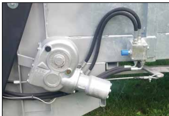
hydraulischer Zug mit Ventil für die Regelung der Geschwindigkeit